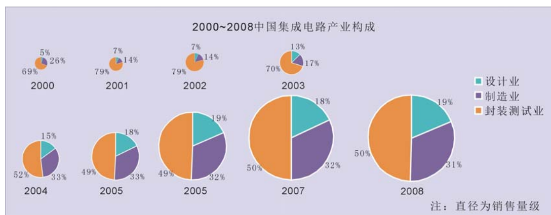
图 2 中国集成电路产业的产业链构成（2000-2008 年）

从 2001 年到 2007 年，中国 IC 产业结构发生了显著变化、更趋合理：封装测试业在 IC 产业中的比重从 79% 下降到 50%，而设计业从 7% 增加到 19%，制造业从 14% 增加到 31%。设计、制造和封装测试的比例约为 2:3:5，与全球 IC 产业 3:4:3 的均衡比例仍有差距，设计业比重较低，而封装测试业比重仍然过高。中国集成电路产业链构成如图 2 所示：